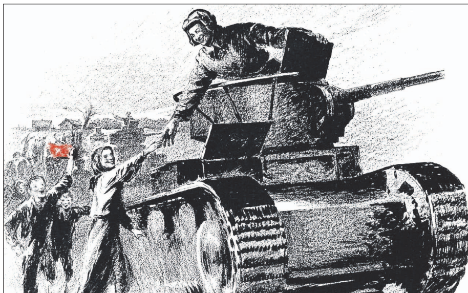
Sowiecki rysunek propagandowy. Ludność Wołynia wita Armię Czerwoną wkraczającą na Kresy Wschodnie Drugiej Rzeczypospolitej w 1939 r.