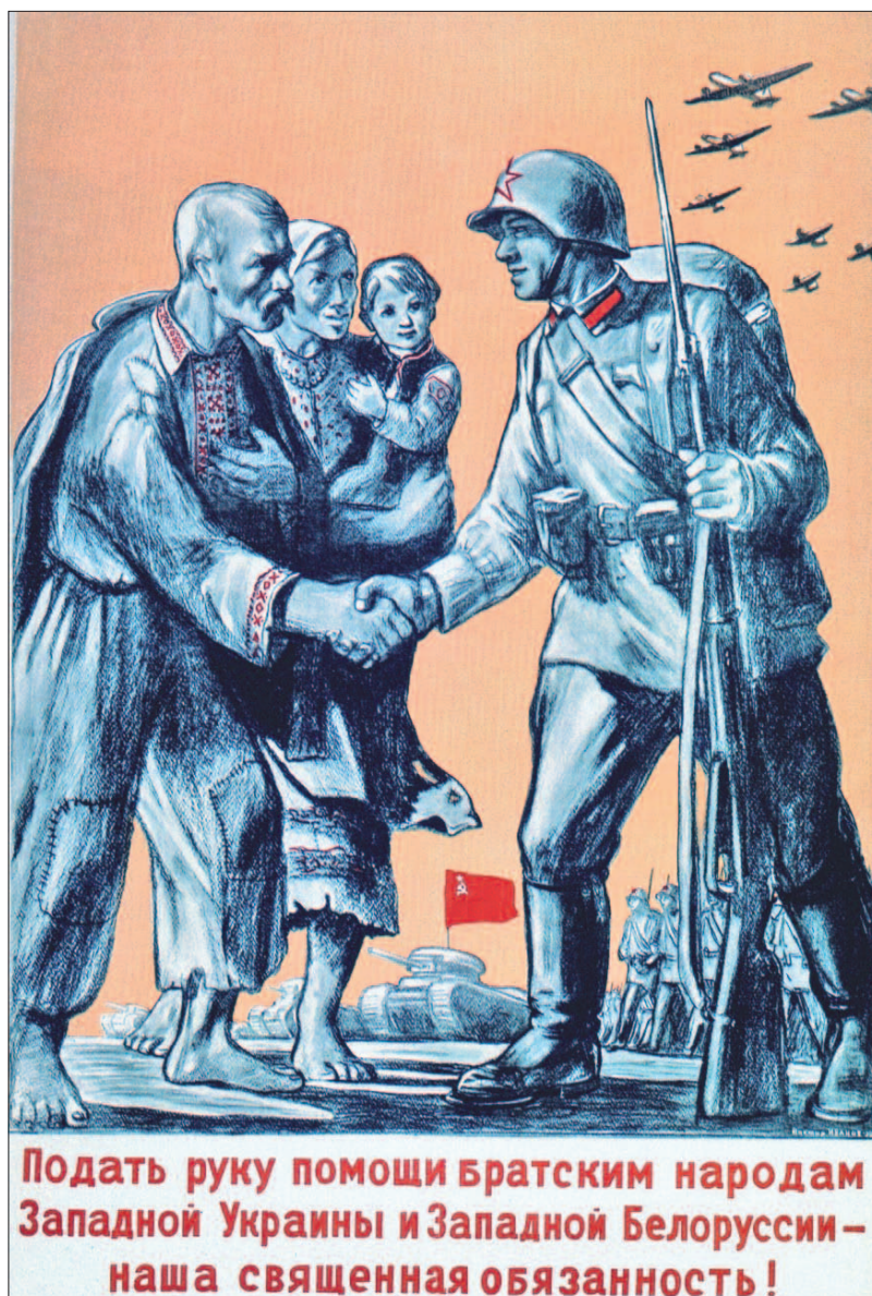
Radziecki plakat propagandowy 1939 r. autorstwa W. Iwanowa

Podanie pomocnej ręki bratnim narodom Zachodniej Ukrainy i Zachodniej Białorusi jest naszym świętym obowiązkiem!