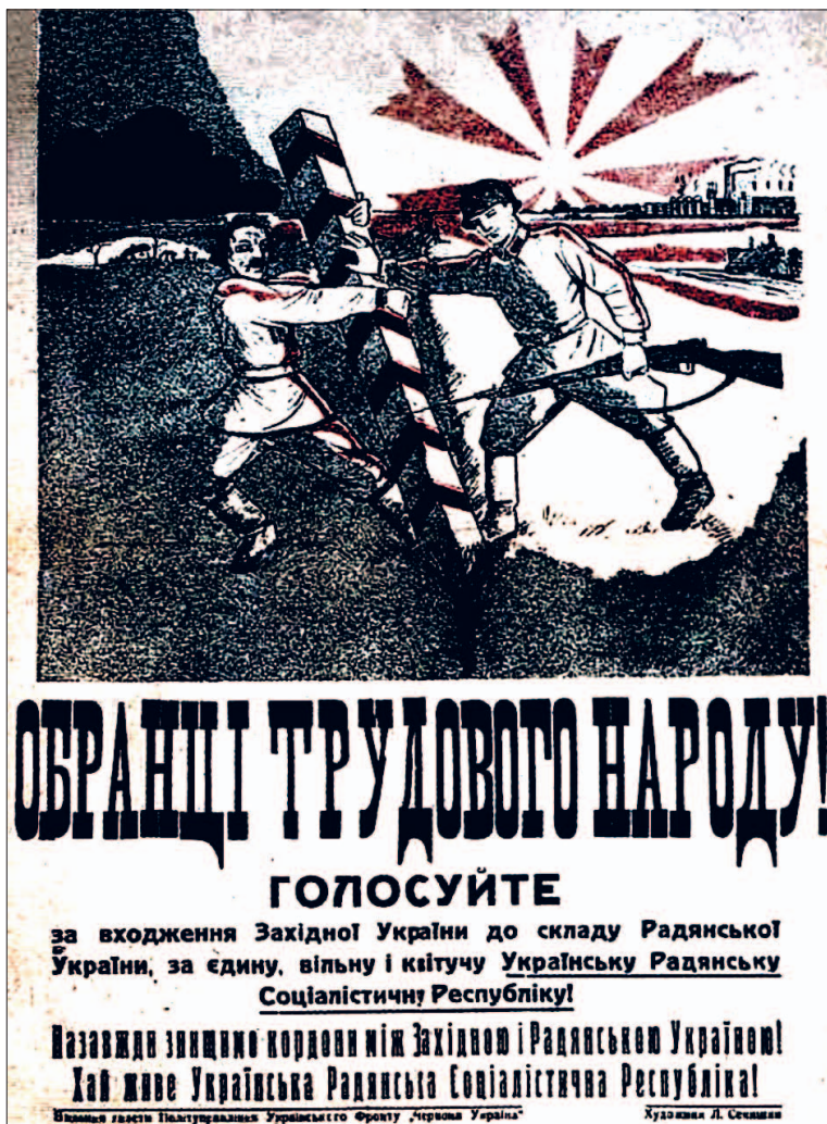
Plakat propagandowy 1939 r. z gazety Zarządu Politycznego Frontu Ukraińskiego „Czerwona Ukrajina”